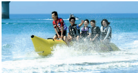
バナナボート(海耕舎)