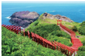
元乃隅神社(周辺観光)