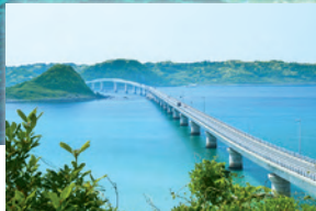
角島大橋(角島観光)