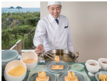
ライブキッチンコーナー