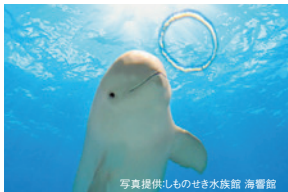
しものせき水族館 海響館(周辺観光)