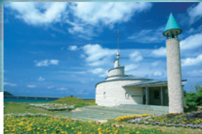
チャペル(当ホテル)

角島は角島大橋が開通してから、自然の美しさ、素朴さ、美しい海が話題となり、映画やドラマのロケ地としても人気となっております。 その他周辺スポットも素晴らしい自然や最高の感動が楽しめます。