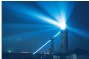
角島灯台公園(角島観光)