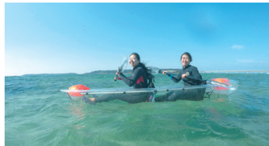
クリアカヤック(海耕舎)