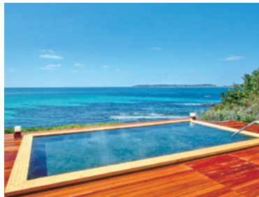
温泉展望露天風呂(あまがせの湯)