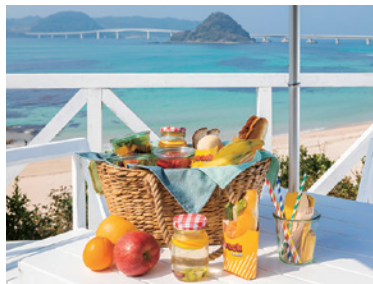
天気の良い日はテラスで朝食を