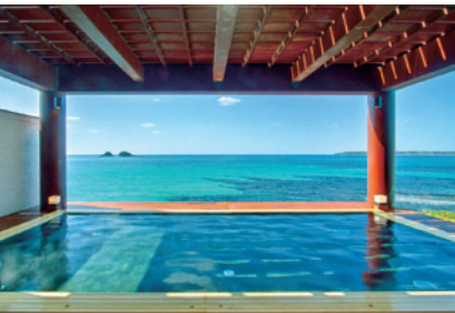
温泉展望露天風呂(タなぎの湯)