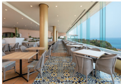
ビュッフェレストラン「Belvedere(ベルヴェデーレ)」