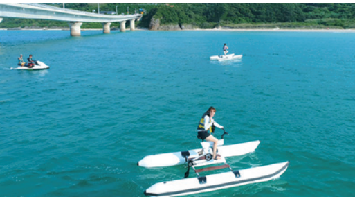
水上サイクリング(海耕舎)